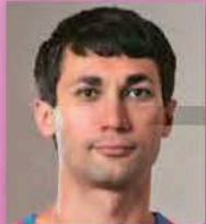
コスチャンチン・ ヴィノヴォイ