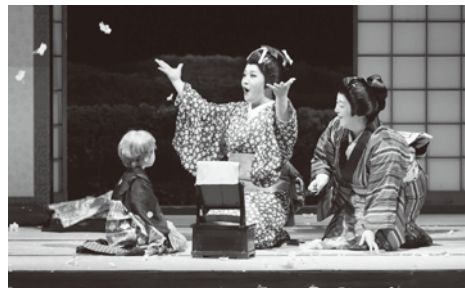
2014年 藤原歌劇団公演「蝶々夫人」より

1973年藤沢市民会館開館5周年を記念して「藤沢市民オペラ」が開催されました。これまで22回の公演を重ね、その取り組みは全国の「市民オペラ」の先駆けとなり、モデルケースとして高く評価されております。