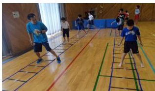
小学生体育力向上プログラム