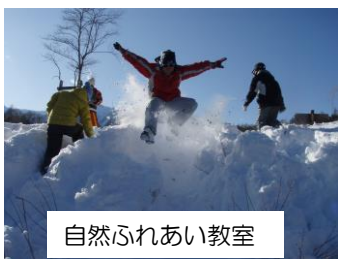
自然ふれあい教室