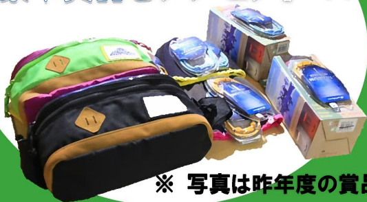
※ 写真は昨年度の賞品