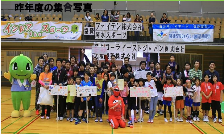
昨年度の集合写真