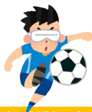
ブラインドサッカー®