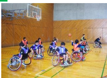
車いすバスケット