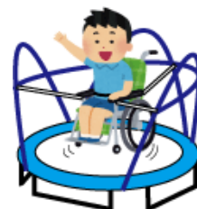
ケアトランポリン