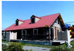
施設数は 2019年4月1日現在