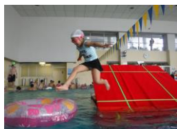
みらい子どもフェスタ