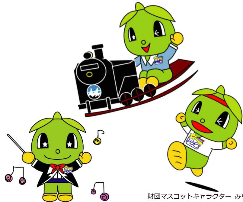
財団マスコットキャラクター みらぞう

公益財団法人 藤沢市みらい創造財団 事務局総務課 〒251-0054 藤沢市朝日町 10 番地の 8 TEL 0466-21-7861 FAX 0466-28-9567 URL https://f-mirai.jp