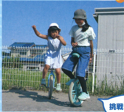
挑戦→失敗→再挑戦→成功

児童クラブでは、ブロックやおままごと等の室内遊びと、けん玉やおはじきといった伝承遊び、さらに鬼ごっこやフットベースのような集団遊びまで、ルールを学びながら多岐に渡る遊びをしています。