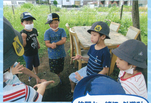
仲間と一緒に、外遊び