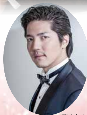
大西 宇宙 バリトン