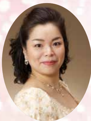
中島 郁子 メゾソプラノ