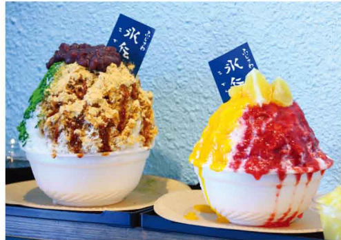
(左)黒蜜きな粉抹茶 あんこ付……………1,080円(税込) (右)苺&マンゴー&湘南ゴールド……………1,180円(税込)