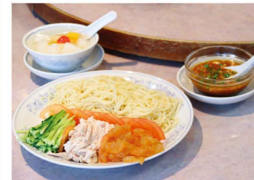
(手前)棒棒鶏冷麺……………1,100円(税込) (左奥)杏仁豆腐……………400円(税込)