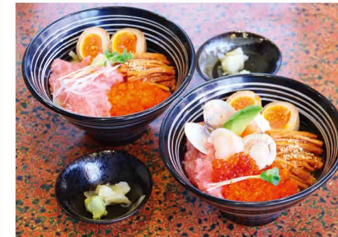
(左)ちらし麺・竹……………920円(税込) (右)ちらし麺・松……………1,350円(税込)