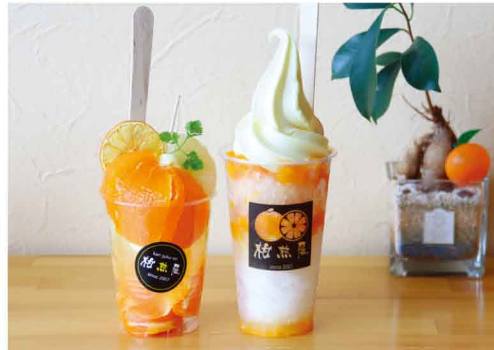
(左)みかんパフェ……………650円(税込) (右)シェイプソフト……………500円(税込)