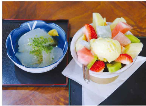
(左)ところてん……………550円(税込) (右)クリームあんみつ……………750円(税込)