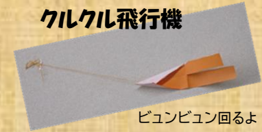
ビュンビュン回るよ!