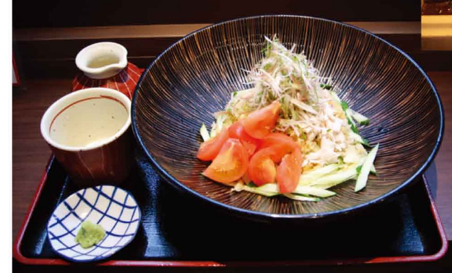
冷やしたぬきそば 1,200円(税込) ※9月末までの限定メニュー

こちらの夏のイチオシは「冷やしたぬきそば」です。ミョウガやネギ、シソなどの薬味がうず高く盛り、添えられたトマト・キュウリがみずみずしく涼しげな見た目が食欲をそそります。のど越し・食感を重視して