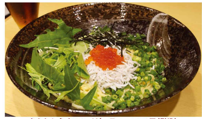
あかねしらすのスパゲッティ 1,573円(税込)

2019年、10年振りにここ藤沢へ帰って来た「J PASTA」！ 当時から種類が豊富でしたが、さらに新メニューが増えていて、どれにしようか迷ってしまいます。今回は、この時期のおススメ「あかねしらすのスパゲッティ」を注文。こちらは、ここ湘南の地元メシである「しらす丼」感覚で食べられるスパゲッティを求めて誕生した逸品です。