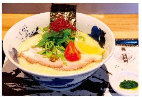
冷やしホワイト 1,100円(税込)

ですっきりとしており、それでいてコクがある味わい。老若男女問わず愛される味で、高齢の方や女性の方にも人気が高いそう。夏の新メニュー「冷やしホワイト」は鯛出汁をベースに、まろやかな豆乳とゴマのスープ。レモンを絞って味変するときはさわやかさを増し、暑い夏でもさっぱりといただける涼味満点の一品です。どちらにもついてくる「ニラペースト」を途中で追加してパンチをプラスすれば、食欲増進間違いなし！ 夏でも通いたくなるラーメン屋さんです。