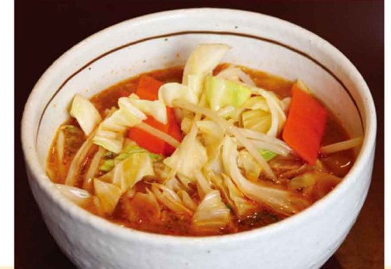
五目野菜刀削麺 820円(税込)

頂いたのは「五目野菜刀削麺」と「牛すね、モツ入り刀削麺」。スープは醤油ベースで、「五目野菜刀削麺」はコクがあるのにさっぱりと食べられ、シャキシャキのたっぷり野菜が女性に嬉しい一品です。「牛すね、モツ