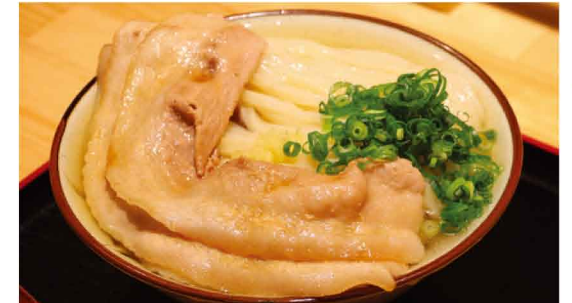
かけ肉(冷)並 715円(税込)

香川県出身の店主さんによる本場の讃岐うどんは絶品です！ 出汁はいりこ、昆布などから丁寧に取っており、麺は粉と塩と水から作るこだわりの自家製麺で、茹でたから15分経った麺はお客様に出さない徹底ぶり。美しい麺の盛り付けも注目です！