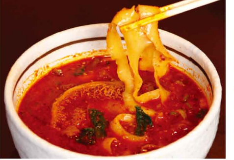
牛すね、モツ入り刀削麺 900円(税込)

入り刀削麺」は、お店で扱う刀削麺の中でも一番辛いメニューですが、辛さは選べるので安心して注文できます。牛の第2の胃「ハチノス」など様々なモツが入っていて、モツ好きにはたまりません。また、刀削麺はやはり刀で麺を切る姿が楽しみの一つ。こちらのお店は厨房が見えるので、刀削麺を注文したら調理姿が見られるかも！