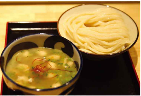
元祖とりかわ(冷)小 528円(税込)

① 藤沢市藤沢556 サンパールIIビル地下1階 ② 11:00~15:00(LO14:30) / 18:00~21:00(LO20:30) ③ 不定休(Facebookをご確認ください) ④ なし ⑤ 50席 ※必ずFacebookを事前にご確認ください。