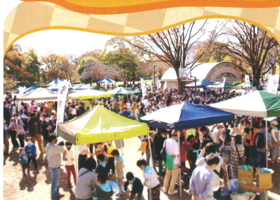
📍 出店ブースの様子(北ブロック)