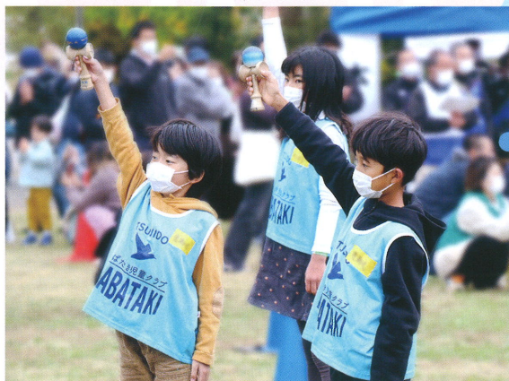
📍 開会式、リズムけん玉(南ブロック)

当日は、開会式と閉会式で、参加児童がリズムけん玉を披露し、それぞれの児童クラブは遊びブースを出店しました。参加児童は