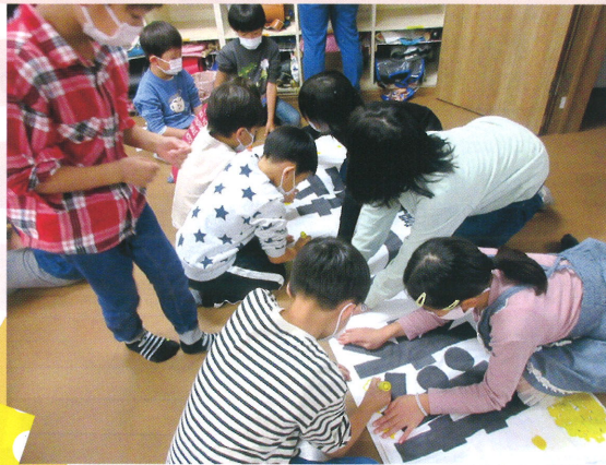
📍 児童クラブでの準備の様子

たくさんの来場者に、準備してきた工作を丁寧に教えたり、一緒にゲームで盛り上がり、互に関わり合う姿があちらこちらで見られました。保護者、運営委員、一般の方たちにもご参加いただき、新しい形の児童クラブ交流会が誕生した瞬間でした!