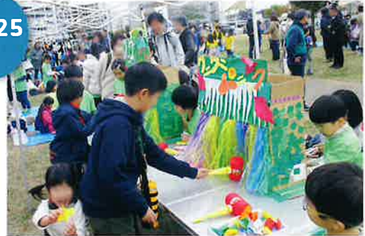
神台(シークロス)公園会場