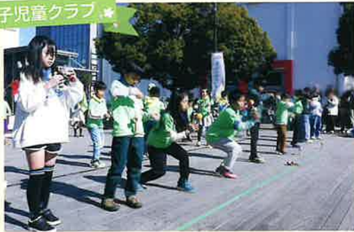
けん玉パフォーマンス