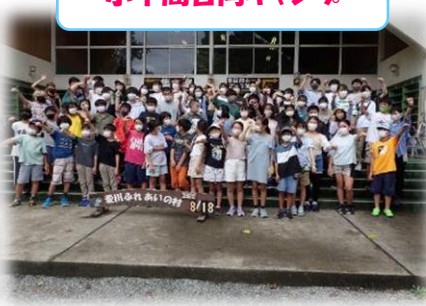
小中高合同キャンプ