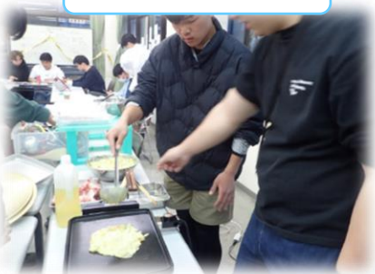
お別れパーティー