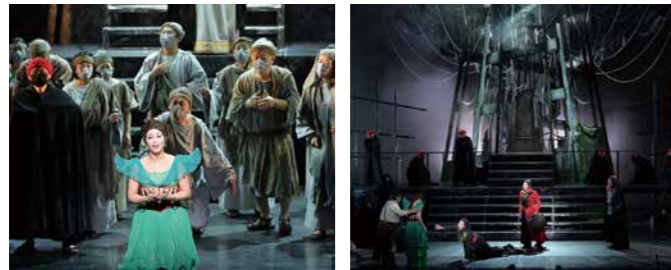
写真：第24回藤沢市民オペラ「ナブッコ」より

観に行ってみたくて、子どもは入れるの？そもそも市民オペラってなに？そんな疑問をボクと一緒に解消していこう★