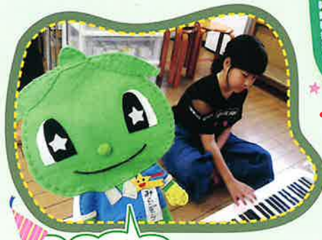
お友だちの伴奏で歌ったよ