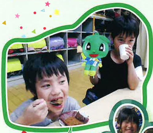
ケーキは人気のおやつ

その後は誕生日会にふさわしく、ケーキなどのスペシャルなおやつを食べて過ごし、みんなで鬼ごっこをして盛り上がりました。