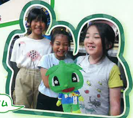
インタビュータイム