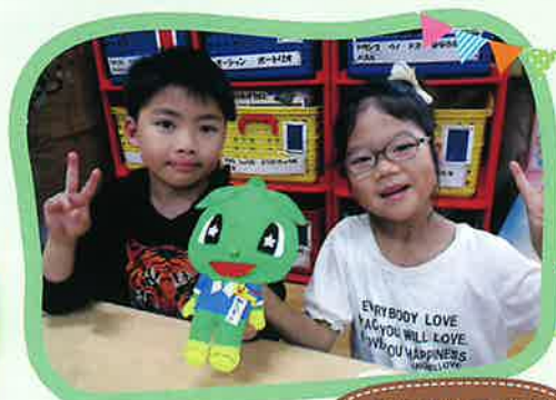
みらぞう君、次はどこ児童クラブに!? お楽しみに♪

誕生日会という特別な日を児童クラブのお友だちと一緒に過ごしたみらぞう君。主役の子もたちの恥ずかしながらも嬉しそうな顔を見て、心がほっこりしました。誕生日を迎える仲間が大切にされているんだな、と感じたみらぞう君でした。