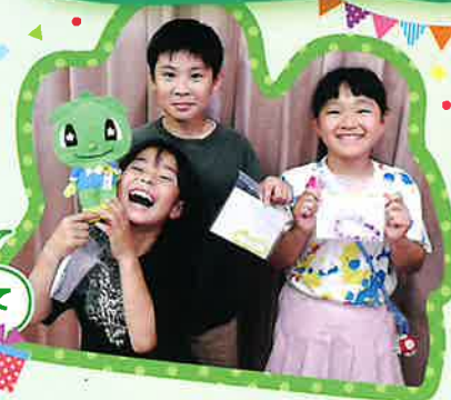
プレゼントをもってハイチーズ