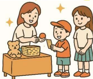
チャリティバザー