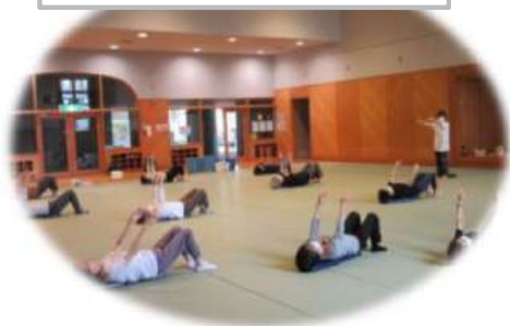
シニアのためのエンジョイ運動