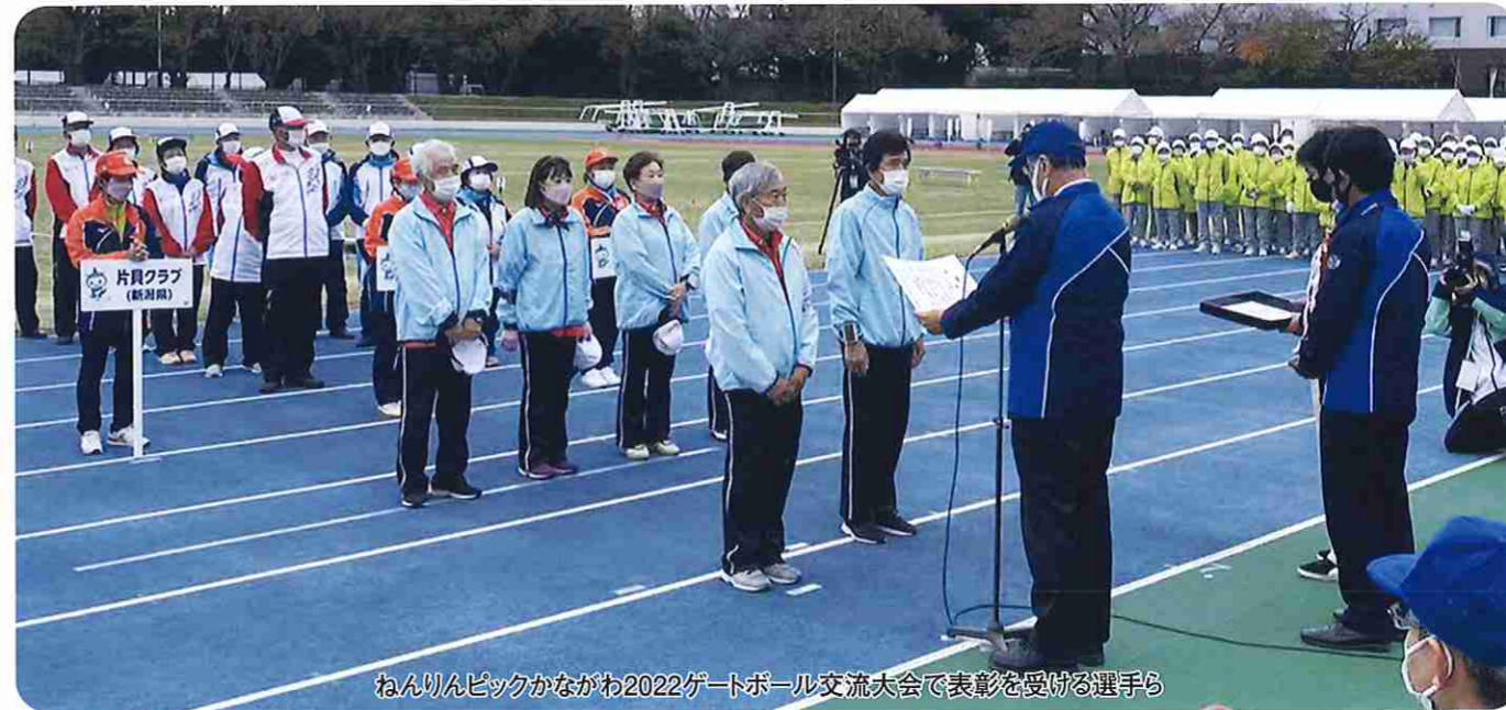
ねんりんピックかながわ2022ゲートボール交流大会で表彰を受ける選手ら