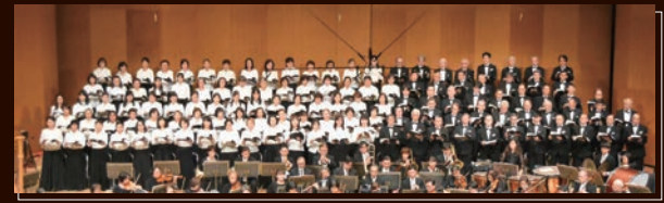
《合唱》藤沢市合唱連盟