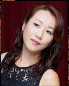
エレナ 森谷真理

初演から200年、充実のキャストで日本初演！ 『セミラーミデ』に続く 藤沢ロッシーニ・シリーズ第2弾