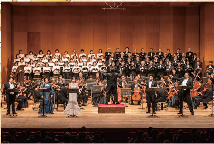
2023年11月26日 藤沢市民オペラ50周年記念 G.ロッシェニ「オテット」演奏会形式