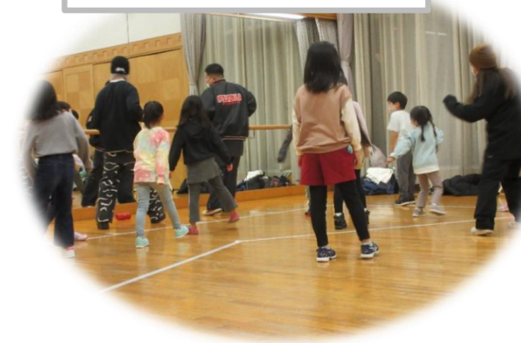
はじめてのキッズヒップホップダンス