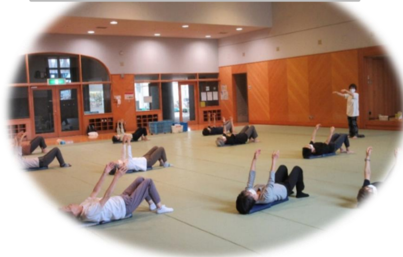
シニアのためのエンジョイ運動