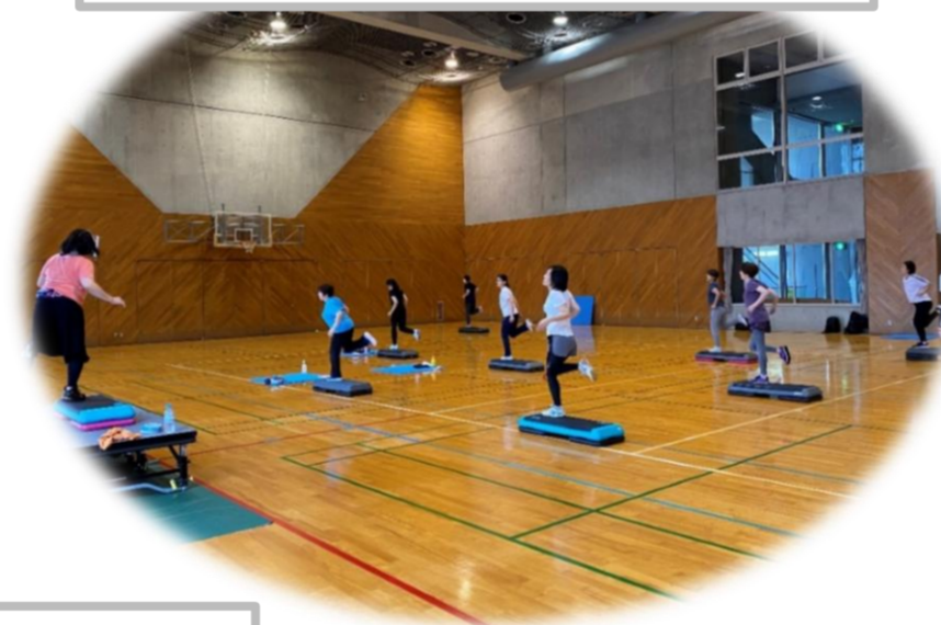
オープン教室 らくらくステップ