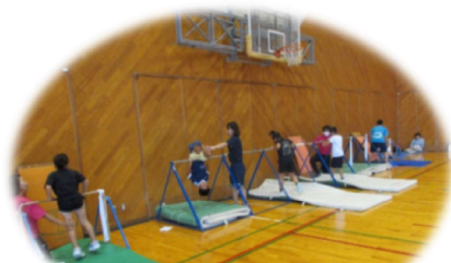
夏休み小学生逆上がり