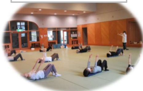
シニアのためのエンジョイ運動